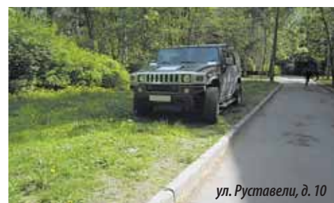
ул. Руставели, д. 10