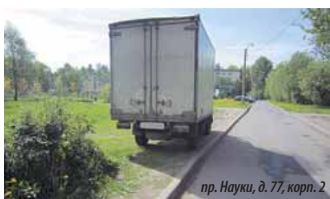
пр. Науки, д. 77, корп. 2

Чей «железный конь» окажется «антигероем» следующего номера газеты и попадет в чарты нашего непопулярного хит-парада, покажет время.