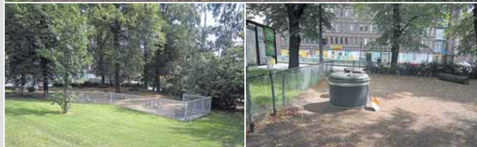
Вот так выглядит обычная площадка для выгула маленьких собак в сквере в центре Хельсинки

Так в Хельсинки проблему выгула собак решили за 10 лет.