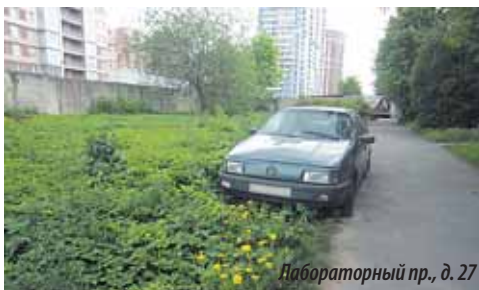
Набораторный пр., д. 27