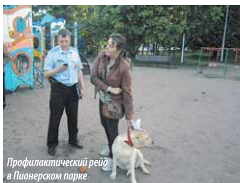
Профилактический рейд в Пионерском парке

Однако первое, что ты видишь при входе в парк, выписку из распоряжения